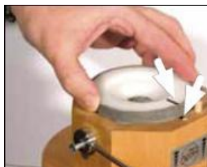
Рис. 7 Поставьте ручку настройки помола в горизонтальное положение. Вложите и закрепите верхний камень совместив маркировку на камне с маркировкой нанесённой на корпусе. Поставьте бункер на место и закрепите его шурупами.

Для сборки мельницы используйте обратную последовательность