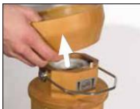
Рис. 4 Снимите бункер для зерна.