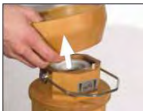
Рис. 4 Снимите бункер для зерна.