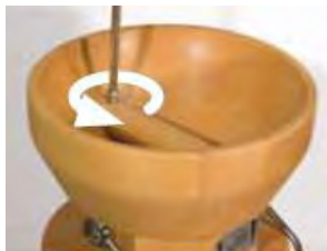
Рис. 3 Открутите два шурупа, которые находятся внутри бункера для зерна.

Внимание! Выключите мельницу и вытащите вилку из розетки!