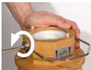
Рис. 5 С двух сторон выкрутите винты крепления ручки настройки помола примерно на 12 мм.