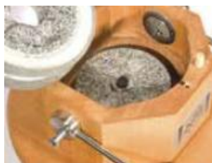
Рис. 6 Вытащите верхний камень.

Для сборки мельницы используйте обратную последовательность