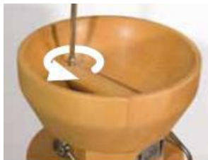
Рис. 3 Открутите два шурупа, которые находятся внутри бункера для зерна.

Внимание! Выключите мельницу и вытащите вилку из розетки!