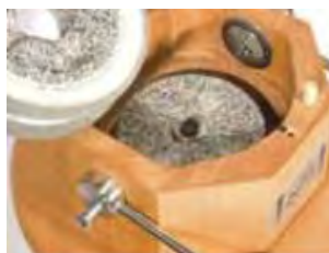
Рис. 6 Вытащите верхний камень.

Для сборки мельницы используйте обратную последовательность