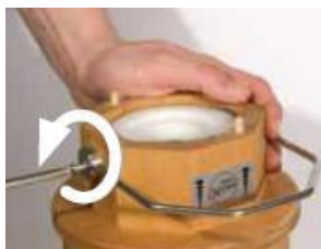
Рис. 5 С двух сторон выкрутите винты крепления ручки настройки помола примерно на 12 мм.