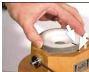
Рис. 7 Поставьте ручку настройки помола в горизонтальное положение. Вложите и закрепите верхний камень совместив маркировку на камне с маркировкой нанесённой на корпусе. Поставьте бункер на место и закрепите его шурупами.

Для сборки мельницы используйте обратную последовательность