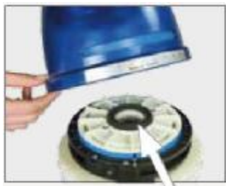
Рис. 7 Проверьте правильность положения резинового уплотнительного кольца. Установите бункер на место, закрутите крепёжный винт и ручку настройки помола.