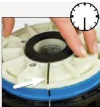
Рис. 5 Строго горизонтально вложите верхний камень в пластиковое кольцо. При этом маркировка на камне должна находиться в положении «6 часов».

Для сборки мельницы, поверните её отверстием для выхода муки к себе