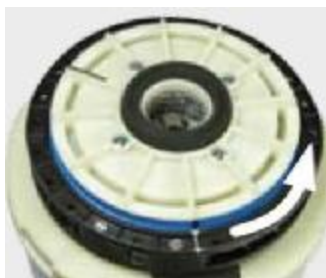
Рис. 4 Открутите верхний камень на пластиковом кольце (с большим усилием!) против часовой стрелки.