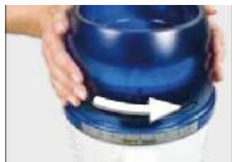
Рис. 3 Двумя руками открутите против часовой стрелки и снимите бункер для зерна.