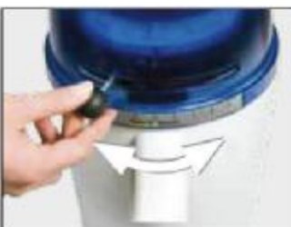
Рис. 8 При помощи ручки настройки помола вы можете бесступенчато установить желаемую тонкость помола от мелкого (влево) до грубого (вправо).