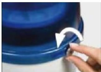
Рис. 2 Открутите крепление бункера на обратной стороне корпуса.