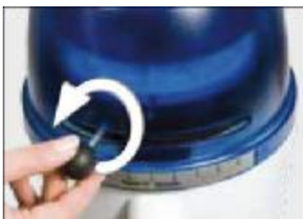
Рис. 1 Открутите ручку настройки помола против часовой стрелки.

Снимите бункер для зерна, как показано рис. 1-2-3